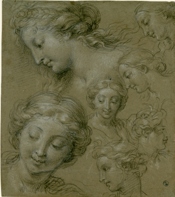
Corneille, Michel dit Corneille des Gobelins, Etude de têtes de femmes , musée Fabre, Montpellier Agglomération

"Le cabinet des Arts graphiques du musée Fabre conserve l'une des plus importantes collections françaises : plus de 6500 gravures et dessins, de Raphaël à Matisse. Cet ensemble remarquable n'est que peu connu des visiteurs car les œuvres sur papier ne peuvent être exposées qu'avec une faible intensité lumineuse et pour de courtes durées.